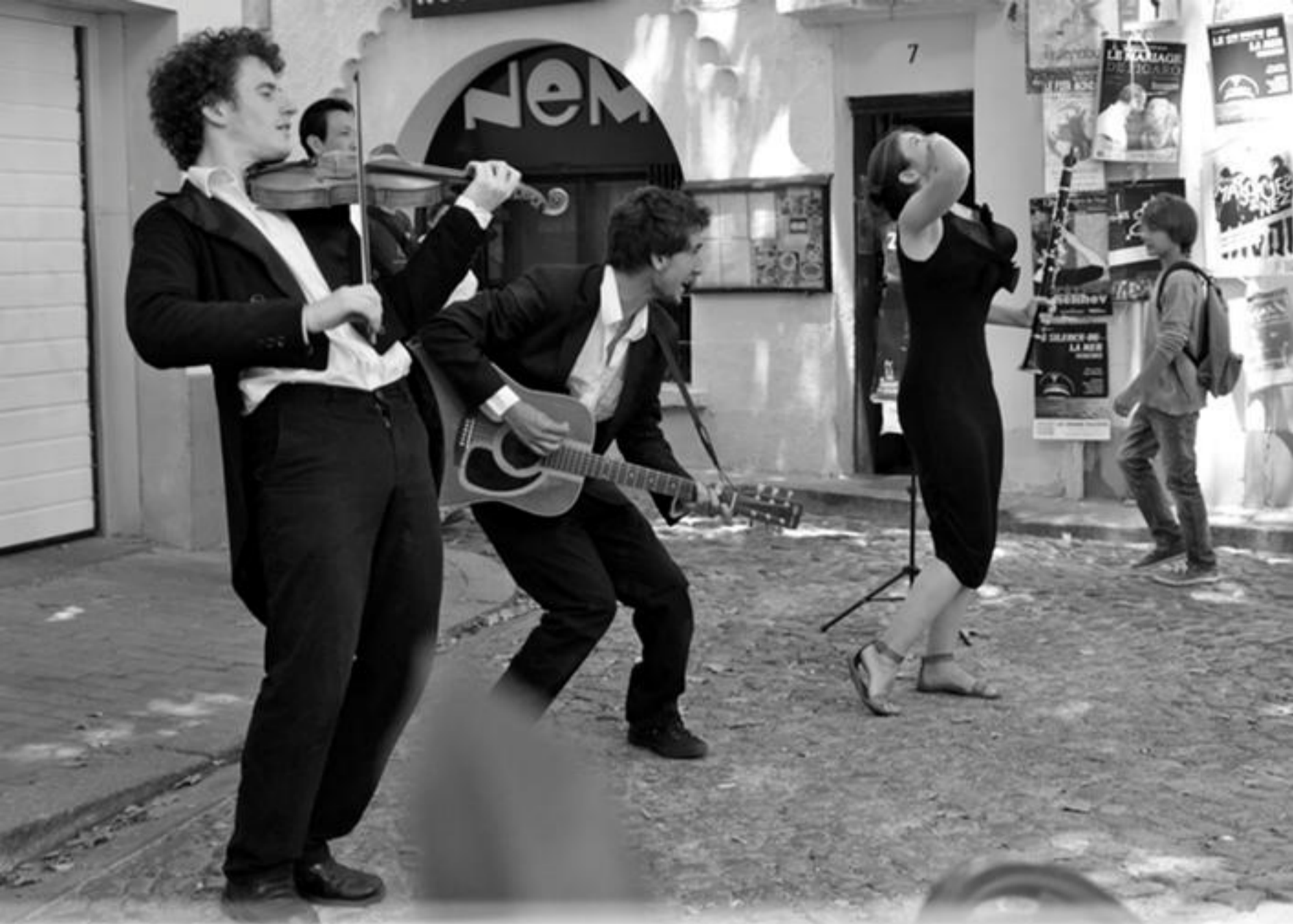
Succès festival Off d'Avignon 2010 et 2011 à guichet fermé - Théâtre du Bourg-Neuf